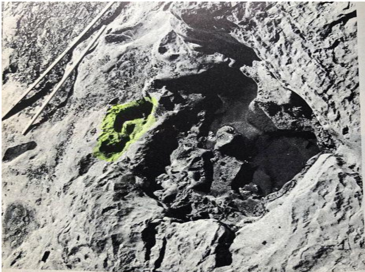
Bild 21 Fußabdruck eines Brontosaurus in der Uferbank des Paluxy-Flusses, zusammen mit dem Fußtritt eines Menschen im Hintergrund. Dinosaur State Park.

2) Nachgewiesen im Fußabdruck eines Brontosaurus zusammen mit dem Fußtritt eines Menschen siehe Bild aus Buch 'Herkunft und Zukunft des Menschen' von A.E. Wilder-Smith: